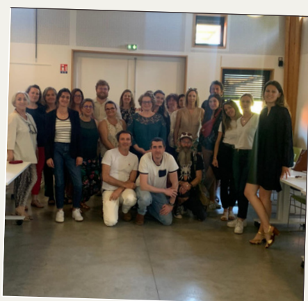
Formation sur les auteurs de violences