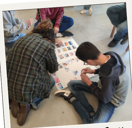
Atelier de la Fresque Santé Environnementale