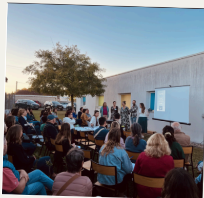
Soirée conviviale au CMP de Pugnac