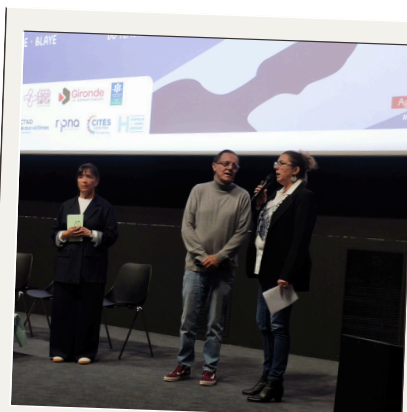
Temps fort sur les violences intrafamiliales