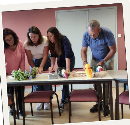
Création d'un escape game sur la Haute-Gironde