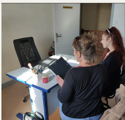
Etude sur le parcours des femmes victimes de violences