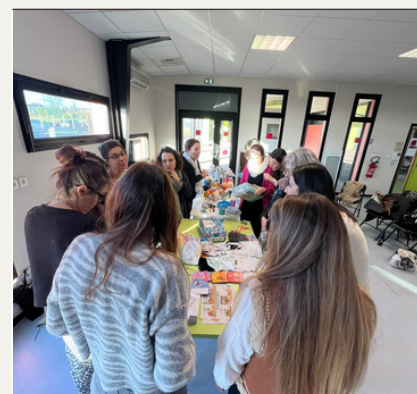
Tournée intercrèches de Haute-Gironde