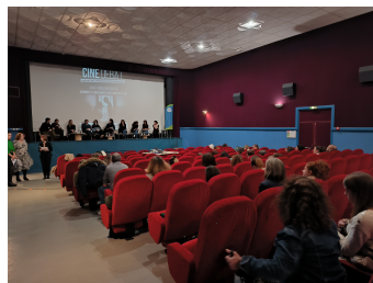
Temps fort VIF du 10 novembre 2023