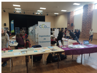
Temps fort VIF du 10 novembre 2023

En décembre, la communauté de communes de Blaye et son CIAS ont organisé un théâtre forum en partenariat avec la compagnie Digame. L'événement a réuni plus d'une quarantaine de personnes qui ont eu l'opportunité d'interagir, de donner leur avis et d'interpréter différemment les scènes jouées par la compagnie. Les participants ont pu découvrir également les stands de Vict'Aid, une association d'aide aux victimes ainsi que Rêv'elles, une association permettant aux femmes d'avoir une bulle de bien-être. Cet événement, qui accueillait également l'exposition "Maux et Mots de femmes", s'est terminé par un moment convivial offert par le CIAS de Blaye.