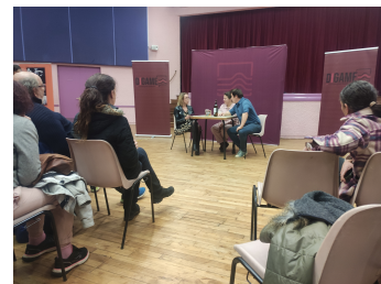
Théâtre forum du 4 décembre 2023